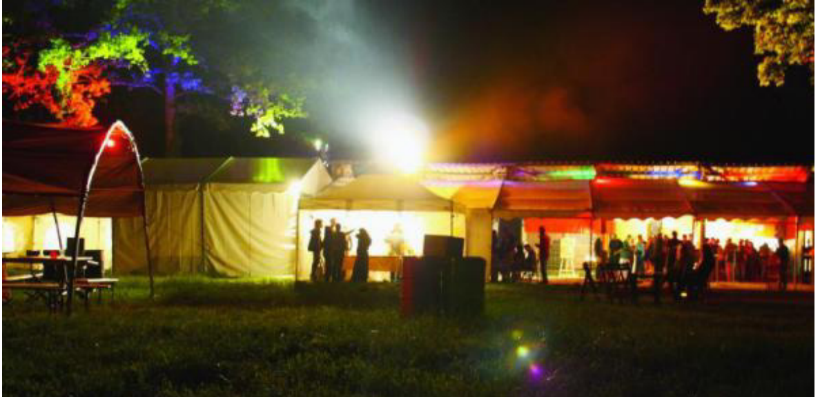
La Nuit des Pieds plats a pris ses quartiers il y a déjà quatre ans déjà au paddock de La Chaux, qu'ils louent à la commune pour 100 francs seulement. L'Association La Chaux 2000, qui organise notamment le Ciné Veyron Open Air sur le même site, leur prête les équipements de cuisine ainsi que du matériel électrique.

20-30 000 francs. le budget estimé par les organisateurs s'ils ne bénéficiaient pas d'arrangements afin de limiter les coûts.